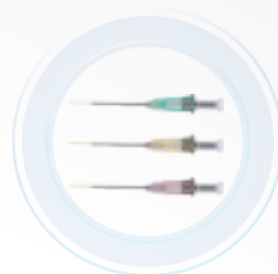
Puntas para diferentes procedimientos Diámetros: 200µm, 300µm, 400µm