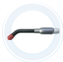
Pieza de mano para Fotobiomodulación puntual