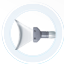
Pieza de mano para aclaramiento Dental